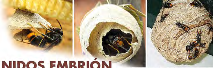
Fases de construcción de un nido primario