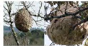
Nidos secundarios © Péro Igor, izquierda / © Tu'uh, derecha (Wikimedia Commons)

Es más voluminoso, de hasta un metro de largo y 80 cm de ancho. Aunque tienen preferencia por lugares altos y seguros (ramas de árboles, aleros de tejados), también se han localizado algunos nidos cerca del suelo.