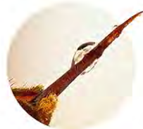
Detalle de su aguijón (de 4 a 6 mm de longitud). Vespa velutina es capaz de segregar veneno en estado de excitación y sin necesidad de picadura previa

Detectada por primera vez en Europa en 2004 en la zona de Burdeos (Francia), su primera cita confirmada en España es en agosto de 2010 en Amaiur (Navarra). En Asturias se detectan los primeros ejemplares en 2014 en el Occidente (San Tirso de Abres) y en 2016 en el Oriente.