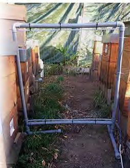
Comparativa entre obreras de Apis mellifera (izq) y Vespa velutina (dcha) Vespa velutina : © Ivar Leidus (Wikimedia Commons)

Arpa eléctrica: herramienta disuasoria aconsejada para la protección de los colmenares.